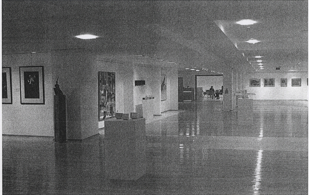
Müze'nin içinden bir başka görünüş (Fotoğraflar: Arş. Gör. Serdar Pehlivan, Hacettepe Sanat Müzesi Arşivi).

Hobsbawm'ın bu örnekten yola çıkarak yaptığı saptama, örneğin kendisi kadar çarpıcıdır: "Geçmişin ya da daha çok kişinin çağdaş deneyimini önceki kuşakların deneyimine bağlayan toplumsal mekanizmaların yok olması geç yirminci yüzyılın en karakteristik ve ürkütücü fenomenlerinden biridir. Yüzyılın sonunda çoğu erkek ve kadın, içinde yaşadıkları zamanın