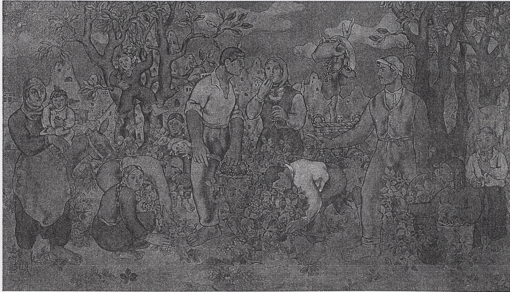
Neşet Günal "Bağ Bozumu" 1956, tuval üzerine yağlı boya, 137x250 cm.

Türkiye toplumunun kendi üretici etkinliklerinin bütünü içinde sanatla ilgili olanların yaşamsallığı konusunda bu yaşamsallığın önemine uygun bir tutum geliştirdiğini söylemek olanaklı değildir. Sanatın büyük ölçüde eğlence sektörünün parçası haline gelmiş olduğu bu kültürel coğrafyada sanat ile hayat arasında büyük bir boşluk oluşmuştur. Eğlence sektörünün hayatın çıplak gerçeğine dönük olarak sistematik bir biçimde "boş verme"yi vaaz ettiği düşünülürse yukarıda dile getirilen boşluğun ürkütücü karakteri ortaya çıkar. İşte böyle bir tarihsel anda Hacettepe Üniversitesi'nin kurduğu Hacettepe Sanat Müzesi bu boşluğa yönelmiş umut verici bir girişim olarak görünmektedir.